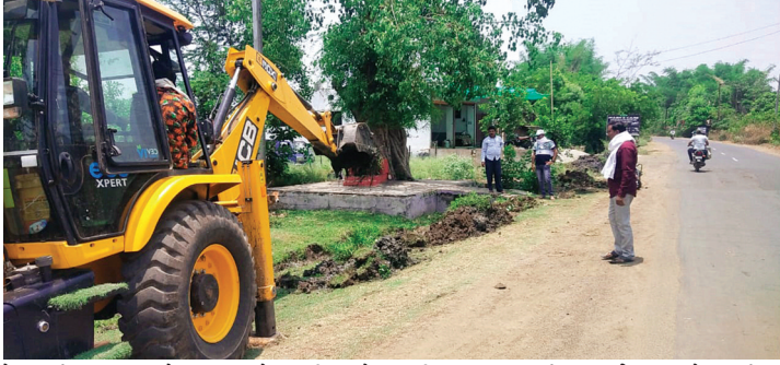
के वार्ड क्रमांक 1 से 15 तक के सभी नाले नालियों की साफ-सफाई गहरीकरण का कार्य किया जा रहा है। ताकि डूब प्रभावित क्षेत्रों में जलभराव

बाढ़ आपदा प्रबंधन एवं अतिवृष्टि से निपटने के लिए नगर पालिका ने नालों की सफाई का कार्य शुरू किया गया है। जिससे बारिश के दिनों में बाढ़ से निपटा जा सके।