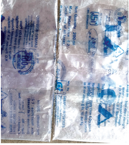
मैं पानी के पाउच बेची जा रहे हैं। इसके लिए नगर वासियों के साथ-साथ पंचमढ़ी में आने वाले टूरिस्ट स्वास्थ्य सेवी खिलवाड़ किया जा रहा है। उसके बाद भी शासन के द्वारा इस पर ध्यान नहीं दिया जा रहा है इस बारे में खाद्य एवं औषधि विभाग के अधिकारी से चर्चा की गई तो उनके द्वारा फोन रिसीव नहीं किया गया।

नगर में पानी के पाउच जो कि लगभग 200 एमल का रहता है जिसकी कीमत 2 रूपए प्रिंट पाउच पर डाला हुआ है। लेकिन दुकानदारों के द्वारा वहाँ पाउच 5 रूपए में बेचा जा रहा है। लेकिन अभी तक खाद्य एवं औषधि विभाग का कहीं कोई पता नहीं है। वर्ष 2023-24 में खाद्य एवं औषधि विभाग के द्वारा नगर में किसी भी होटल पर या किसी भी दुकान पर छापा मार करवाई नहीं की गई है जहाँ पर की पानी के पाउच या अन्य खाद्य सामग्री बेची जाती है। यहाँ तक की खाद्य एवं मोदी प्रशासन विभाग के लिए पैकेज ड्रिंकिंग वाटर के आज दिनांक तक कोई नमूने नहीं लिए गए हैं और ना ही प्रयोगशाला में भेजे गए हैं। नाही जिला कलेक्टर के द्वारा पिपरिया विधानसभा में हो रहे इस व्यवसाय को लेकर जिला कलेक्टर से लेकर जिला अधिकारियों के द्वारा पानी के निर्माण यूनिट गणपति इंस्टीट्यूट अजनेरी सुहागपुर परिसर से भी पिपरिया में पानी की सप्लाई। जिला कलेक्टर के द्वारा अजनेरी में जांच करने के नमूने लेने के निर्देश दिए गए हैं लेकिन पिपरिया में आज दिनांक तक अधिकारियों के द्वारा ना ही पीने के पानी के नमूने लिए गए हैं और ना ही कोई कार्यवाही की गई है। इसके कारण प्रिंट रेट से अधिक